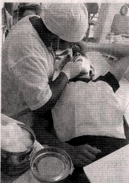
EVALUACIÓN. Para ver cómo se desempeñan en la actividad profesional.

En el equipo de trabajo se desempeñarán menos como "células y más como "tejidos" para así poder destacar en el mercado dental del mediano plazo y, sin duda, poder llegar a la meta planificada de cada uno de sus miembros.