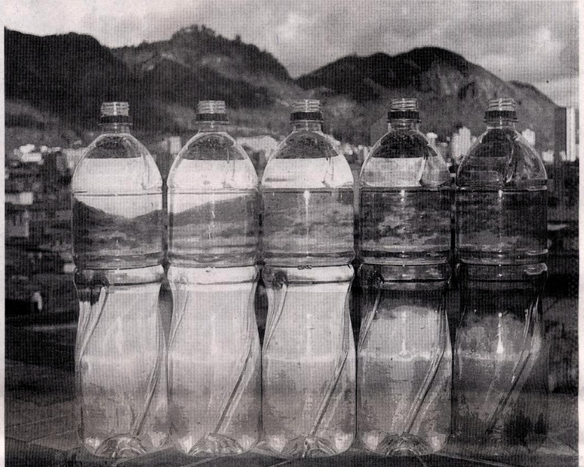
IMPACTO. La producción de botellas plásticas para agua está provocando un grave daño al medioambiente.

Lo mejor es consumir el agua potable hervida o desinfectada con una gota de cloro por litro de agua. Si va al trabajo, los estudios, los aeróbicos, de paseo, etc. lleve consigo su agua hervida, de esta forma contribuirá a la sostenibilidad del planeta, será un consumidor responsable y cuidará su cuerpo.