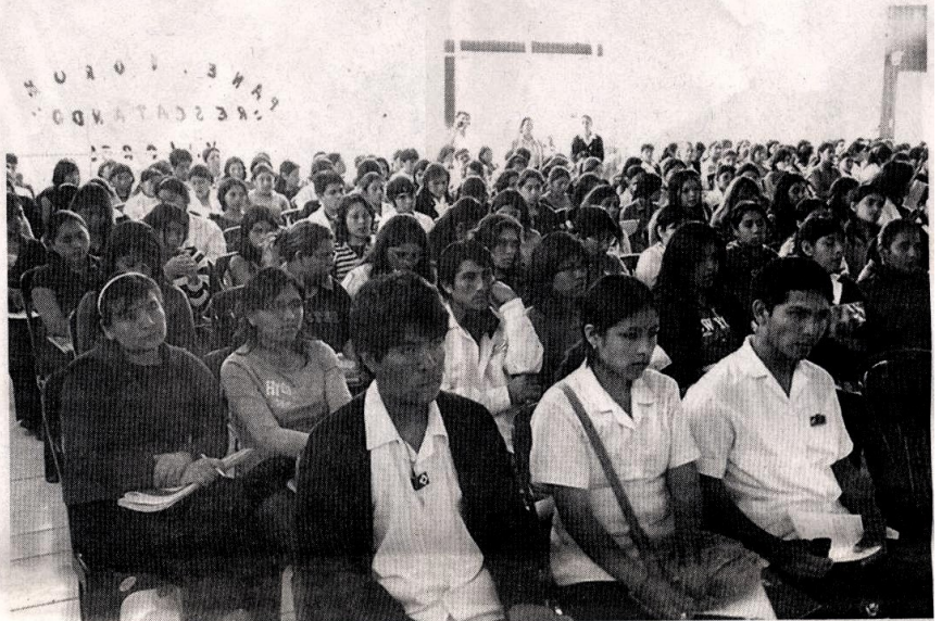
ÉTICA Y VALORES. Es necesario generar de inmediato una cultura de valores en el actuar de la comunidad universitaria.

Quien suscribe realizó un estudio que buscaba conocer el impacto del eje transversal de ética y valores en el desarrollo