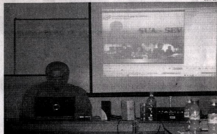
Reto. Las instituciones educativas tienen mayor compromiso con el cambio de vida.

los segundos. En nuestra sociedad estos microsistemas están representados por todas las instituciones que conforman el sistema social peruano; pues bien, de estas instituciones, todas están involucradas en la buena o mala marcha de nuestro país, pero son muy pocas las que se sienten comprometidas con el cambio y la transformación. Es sabido que el cambio de los modos de vida no depende de una sola institución, sino de