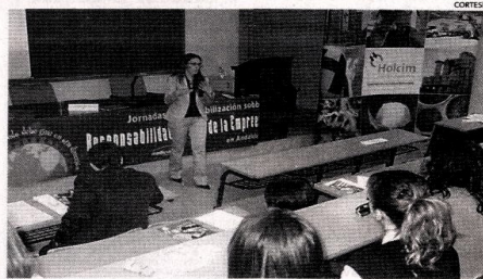
Detalle. Todo problema ambiental es un peligro, pero también una oportunidad.

tarán de mostrar una mejor imagen, desarrollando actividades de responsabilidad social. Deben identificar los riesgos que existan mejorando sus procesos, permitiendo con esto una innovación. Deben también retener a sus mejores trabajadores generando una lealtad para con ella. Estas situaciones son las que debemos aprovechar. No solo encontremos debilidades en un problema ambien-