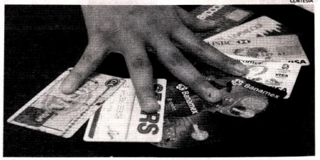
Ojo. Con los intereses al momento de un retiro de efectivo en una tarjeta de crédito

Infocorp y no podrás ser sujeto de crédito. Revisa las tasas de interés por crédito que se encuentran en tu contrato e ingresa a la página de la institución para adquirir las fórmulas y formas de cálculo. Trata siempre de pagar más del monto mínimo que aparece en tu recibo mensual, para que