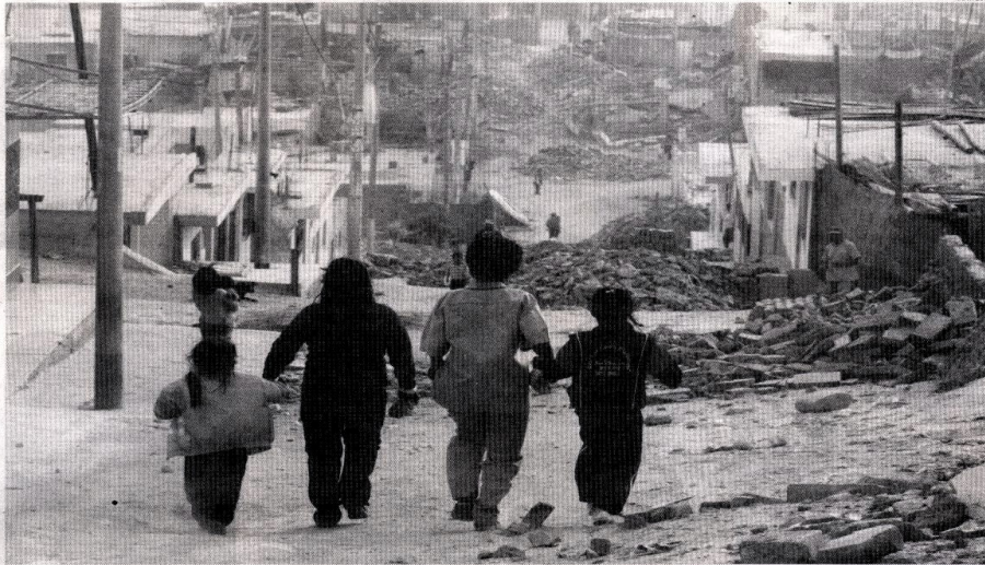
Cruda realidad. La pobreza campea, aunque en las tablas estadísticas de los organismos autorizados para hacer estudios indiquen lo contrario.

La realidad no se condice con las cifras oficiales. ¿Qué hacen al respecto los políticos?