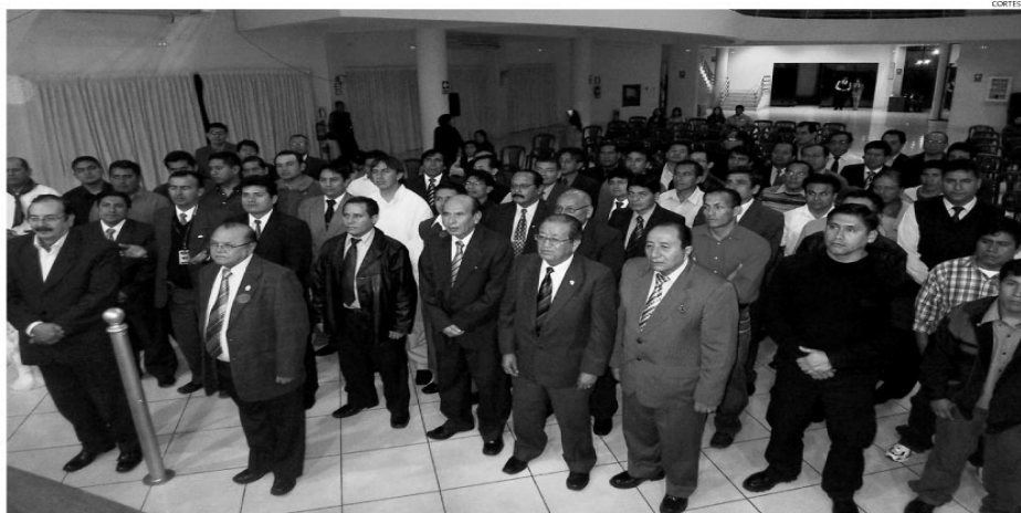
Efecto multiplicador. Mil trabajadores en condiciones laborales adecuadas significa tener a mil familias con calidad de vida. Uladech emprende un gran reto.

Ejecutan charlas de sensibilización en varias empresas y reproducen lo vivido en cuatro meses.