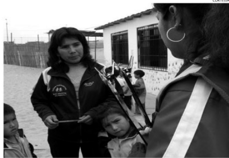
Tarea. Alumnos impulsan la educación para la concienciación de la ciudadanía.

tivo de contribuir a mejorar el entorno social con el desarrollo de actividades de extensión universitaria. Un aspecto importante de la Responsabilidad Social en nuestra sociedad es la conciencia de que somos ciudadanos y que participamos activamente en la construcción de nuestro entorno social. En muchas ocasiones vivimos aislados de nuestra comunidad y olvidamos que con nuestra