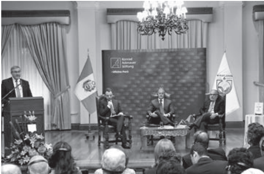
La ceremonia se llevó a cabo en el Palacio Municipal de Miraflores.