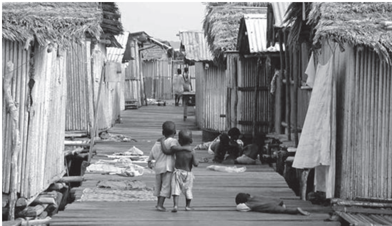
La pobreza se vive a nivel mundial, América Latina es el continente más desigual.

el cálculo en el mundo era de un promedio de 0,65 en los años 80s llegó a estar en 0.8 como promedio mundial, ahora se encuentra cercano al 0.64. Entonces ¿cómo ha sido el progreso en términos de desigualdad desde la redacción de la encíclica? ¿Podemos sentirnos orgullosos de ello?. Al parecer los indicadores nos muestran que no, si bien no hemos retrocedido, nuestro progreso global ha sido realmente mínimo. Es verdad que hay países que resultan tan pobres que tiene un índice Gini muy bajo, semejante a los países desarrollados, porque no hay desigualdad, todos son pobres. Pero el índice Gini con todos sus defectos sigue siendo un indicador importante de la de igualdad que denuncia la Populorum Progressio.