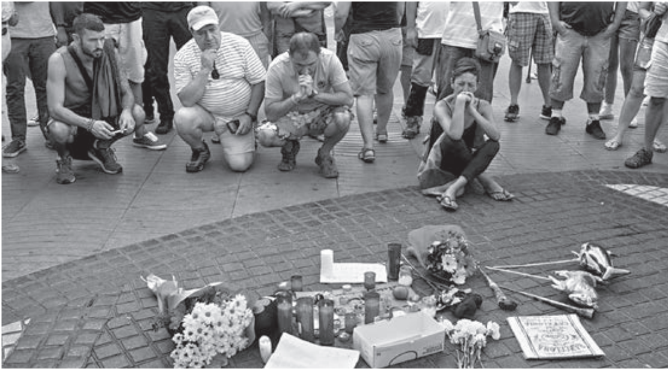
La Rambla, visitada por centenares de personas, fue escenario del brutal ataque terrorista, donde 16 personas fallecieron en la ciudad de Barcelona.

Ramblas, visitadas diariamente por centenares de personas. Así fue; a las 5 de la tarde del siguiente día 17 de agosto, una furgoneta irrumpió en la cabecera de las Ramblas y a velocidad endiablada y zigzagueando, fue atropellando a los peatones. Se copió el rudimentario método que utilizaron los terroristas en el atentado sangriento con el camión que invadió el Paseo de los Ingleses de Niza, en Francia. Esta vez, en Barcelona, hubo 16 muertos y muchos heridos de diversa gravedad. El conductor, huyó a pie. En su huida encontró a un joven al que apuñaló mortalmente y robó su coche para huir de la ciudad; en un control, atropelló a una policía y se dio a la fuga. Fue localizado al cabo de un par de días y abatido mortalmente por miembros del cuerpo de policías del gobierno catalán, que se denomina Mossos de Escuadra. No acabó aquí la historia. El resto del grupo terrorista, intentó un nuevo atentado en forma de atropello de peatones en la población de Cambrils. Un Audi 3, encaró el paseo Marítimo de la localidad. Pero allí estaba apostado un control policial. Intentan saltárselo; suben a la acera, atropellan a una mujer que posteriormente fallece;