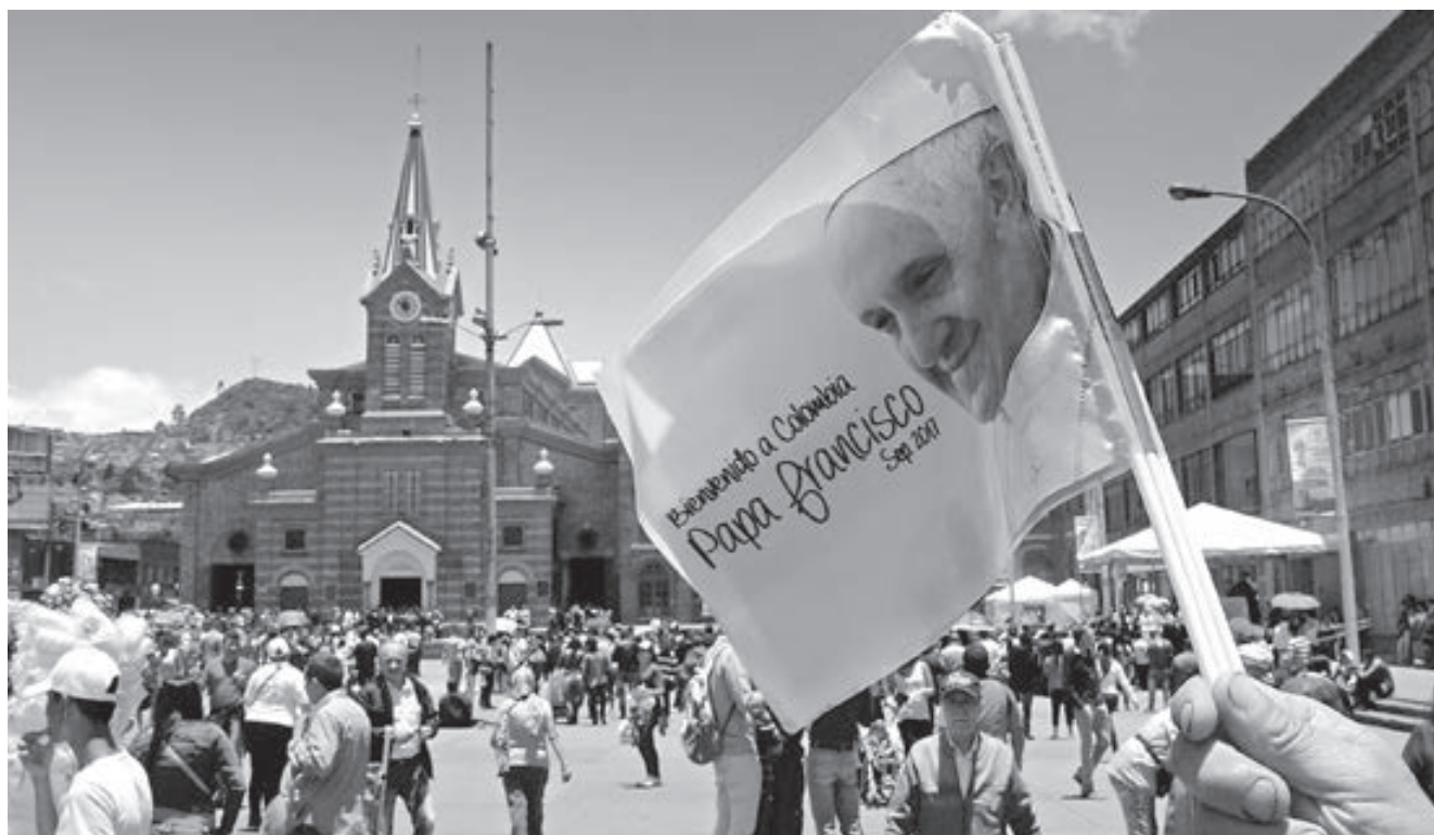
En su visita a Colombia, el Papa, difundió un mensaje de reconciliación y perdón.

pulsó con su visita, el diálogo entre Cuba y Estados Unidos. En su primer discurso al llegar a la isla caribeña lo dejó muy claro: “Desde hace varios meses, estamos siendo testigos de un acontecimiento que nos llena de esperanza: el proceso de normalización de las relaciones entre dos pueblos, tras años de distanciamiento”.