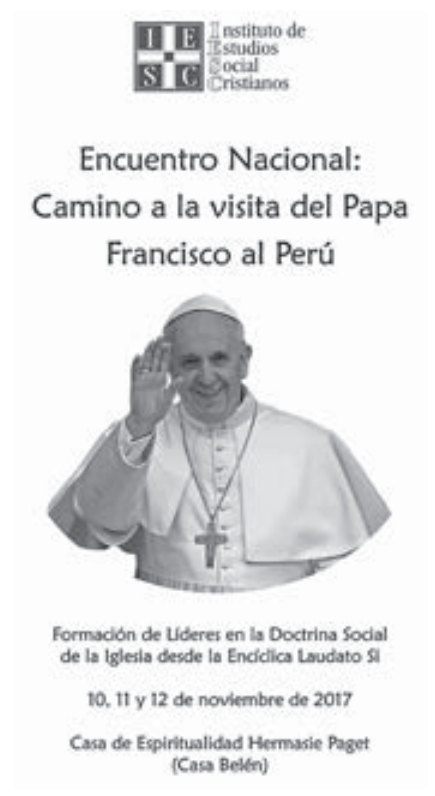
Afiche oficial del Encuentro Nacional 2017.