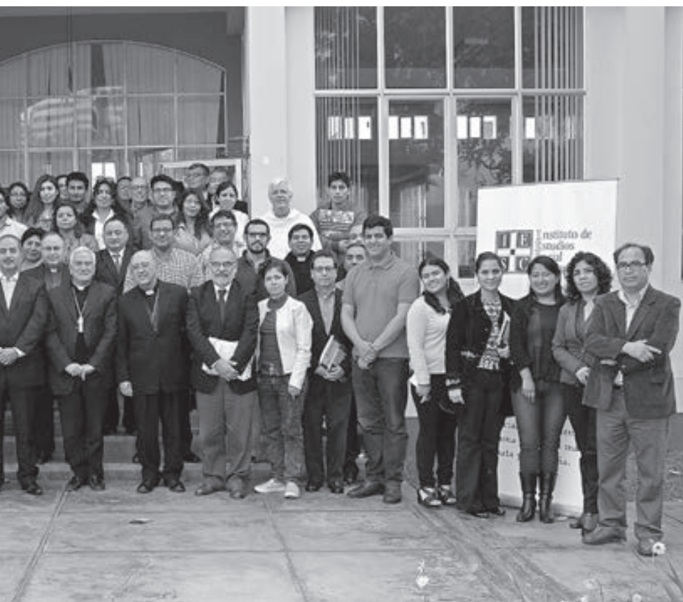
El Encuentro Nacional: Camino a la visita del Papa Francisco al Perú, contó con la participación de delegaciones conformadas por jóvenes, universitarios y docentes de diversas ciudades del país.

se requiere una aproximación integral para combatir la pobreza”.