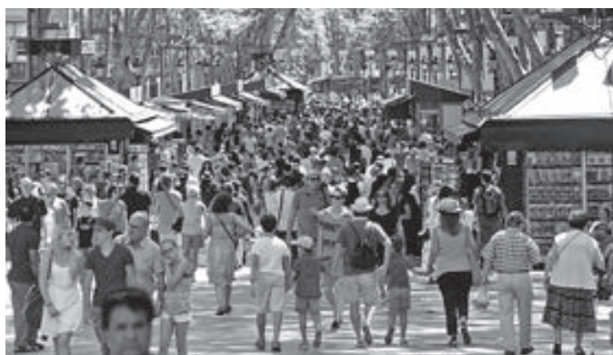
La Rambla de Barcelona.

El gobierno español, por intereses electorales, cometió el error de empecinarse en atribuir a ETA la autoría del atentado, cuando todos los indicios y todos los medios informativos