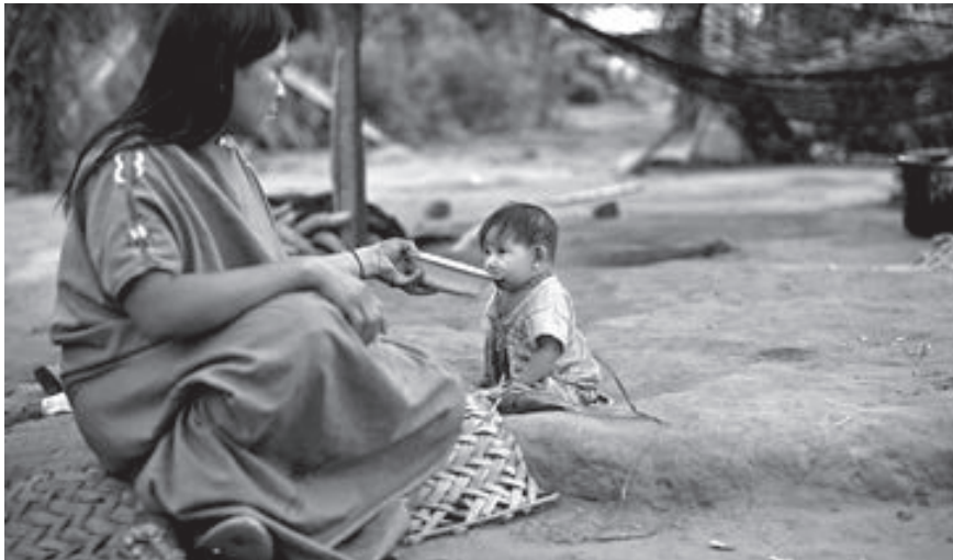
En su visita a Puerto Maldonado el Papa Francisco tiene programado un almuerzo con los indígenas.

presidirá el Sumo Pontífice, en la explanada de Huanchaco. En horas de la tarde, el Santo Padre se dirigirá a este recinto eclesial, para ofrecerle a esta advocación mariana un arreglo floral.