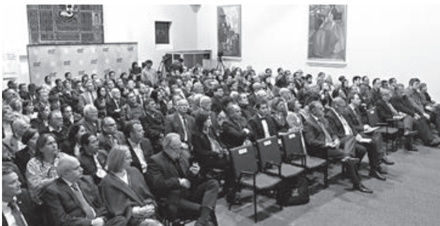
La presentación contó con la presencia de connotadas personalidades.

de los proyectos de ley en favor de la sociedad en ese país. El Papa Francisco en su discurso nos invita a cambiar la Iglesia tanto por fuera como por dentro. Cambios que provocan que algunos retornen a ella, tal como sucede en Europa y otros lugares.