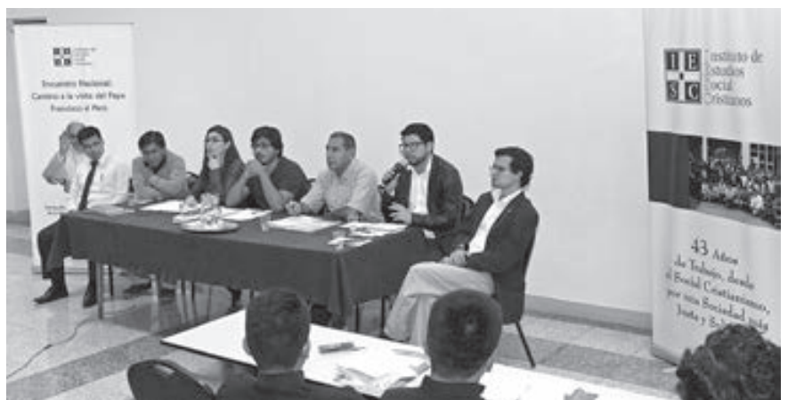
Mesa sobre “El desafío de la descentralización frente al cambio climático”.