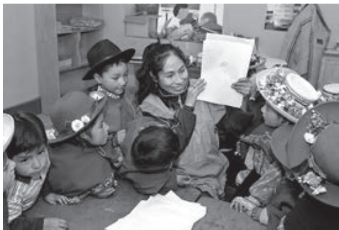
Desigualdad: Las acciones de los gobiernos de turno han sido insuficientes.

La aparición del desarrollo como ampliación de capacidades tomó