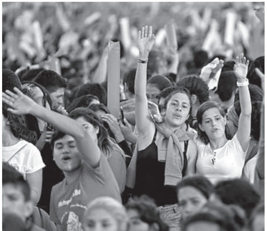
Los jóvenes esperan con entusiasmo al Papa.

Tender puentes es una de las claves de su pontificado. Por eso, im-