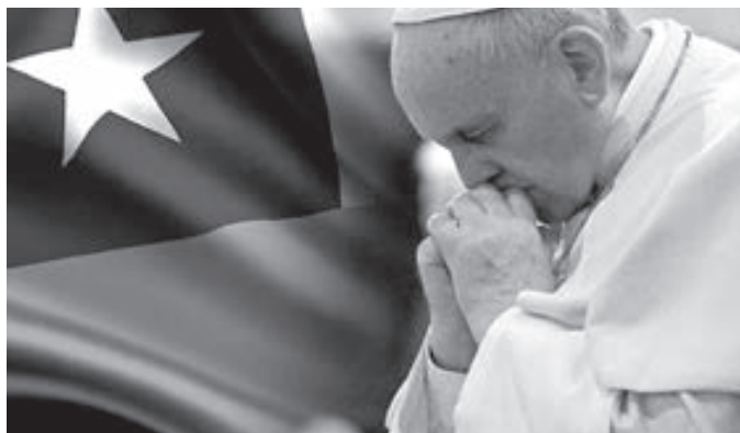
Chile se prepara para la llegada del Papa Francisco.

Por su parte, la Comisión Nacional de la Visita ha elaborado fichas para realizar encuentros comunitarios, tanto para