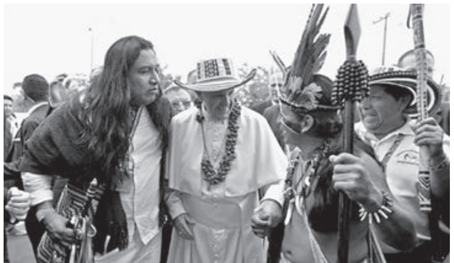
El Sumo Pontífice contribuyó al proceso de paz y reconciliación.

En un gesto de agradecimiento el Papa Francisco se colocó la ruana, prenda de abrigo que en algunos países es conocido como poncho. Sonríe el Santo Padre, al mismo tiempo que recibe el velón, como la luz que