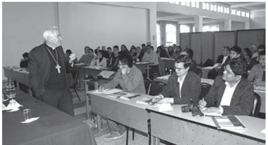
Moseñor Nicola Girasoli, Nuncio Apostólico en el Perú, el primer día de encuentro.

La vida de los cristianos en la Iglesia se