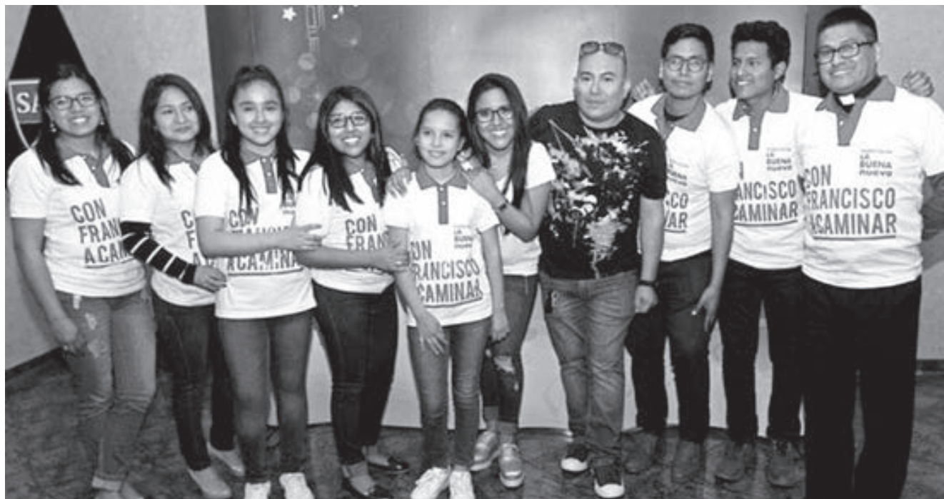
Jóvenes del grupo ganador celebran el primer lugar en el concurso oficial para el Himno al Papa.