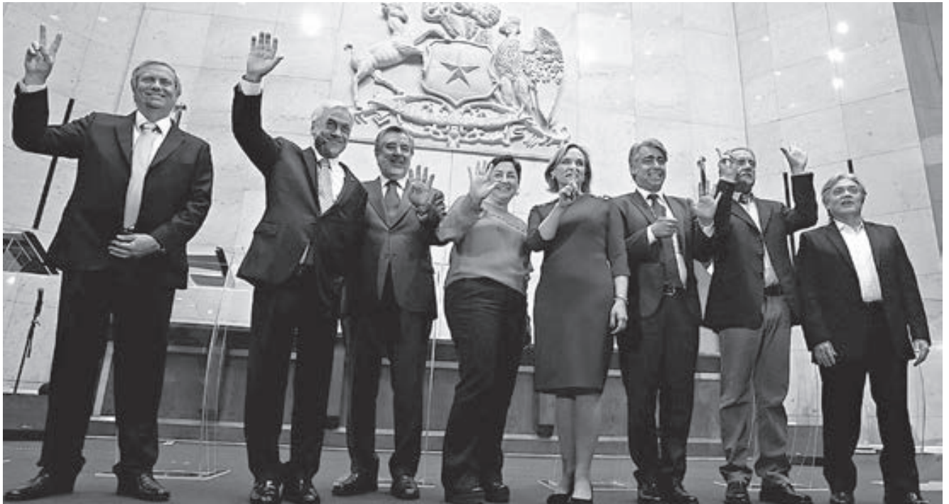
(Izq. a der.) Los ocho postulantes a la presidencia de Chile, José Antonio Kast, Sebastián Piñera, Alejandro Guillier, Beatriz Sánchez, Carolina Goic, Marco Enríquez-Ominami, Eduardo Artés y Alejandro Navarro.

farándula, lo que de alguna manera refleja el desprestigio de la actividad política. Reafirmando lo anterior, hay que recordar que dos exitosos candidatos presidenciales surgen desde los medios de comunicación: Alejandro Guillier y Beatriz Sánchez. Pareciera que primero hay que buscar una figura popular, luego agregarle contenidos. Lo que no se conversa, es que este cuadro puede abrir espacios a aventuras populistas y transformar la actividad política en una especie de supermercado donde es posible escoger productos-ofertón, pero que no tienen necesariamente coherencia. Así resulta difícil construir un proyecto país.