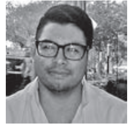
BRUNO V. CROSE*

Un Papa venido desde el fin del mundo, nos hace llegar el mensaje más cercano de solidaridad, de amor, de inclusión, de alegría, de unidad pero sobre todo de esperanza. El Papa nacido en las pampas latinoamericanas, hoy viene haciendo un viaje pastoral y de peregrinaje, de oración por toda Latinoamérica, un mensaje que cala poco a poco en jóvenes, políticos, religiosos y no creyentes. Pero quiero referirme a dos temas importantes, el reto en Latinoamérica y la institucionalización de sus instituciones.