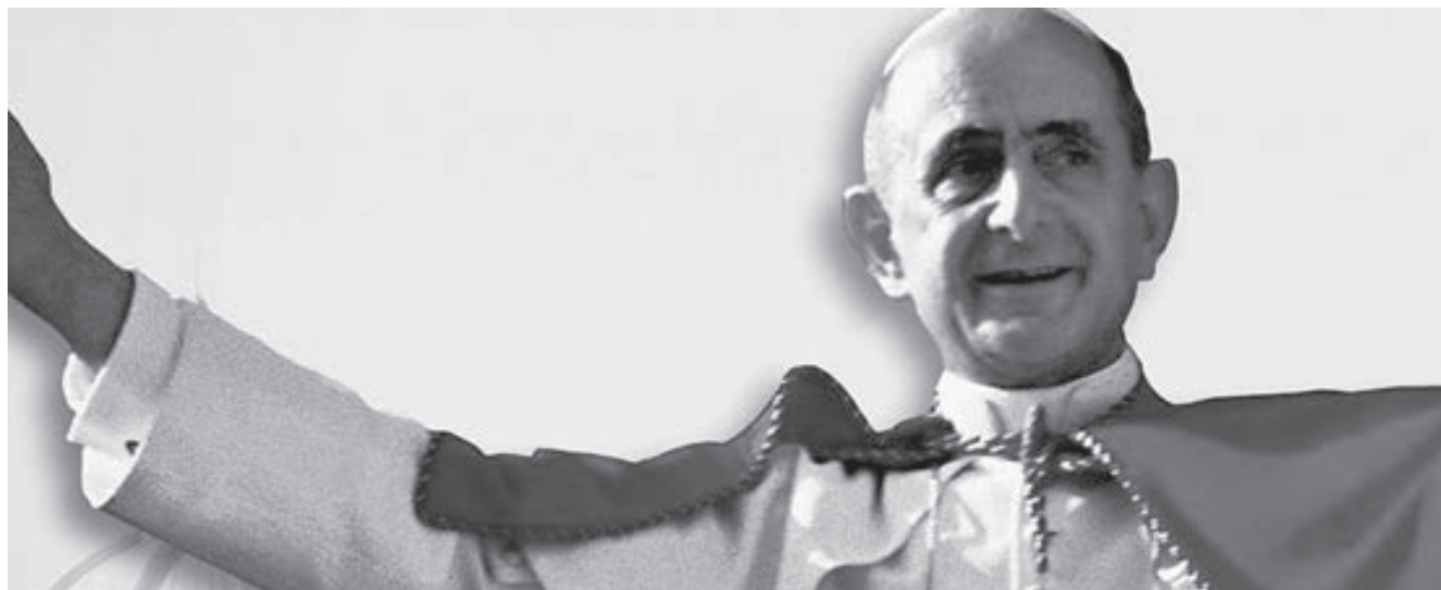
Populorum Progressio, cumple 50 años, siendo el tema principal el desarrollo integral y solidario frente a crecientes desigualdades económicas y sociales.

condiciones de vida menos humanas, a condiciones más humanas” (PP 20); un proceso que Pablo VI describe concretando esas condiciones “menos humanas” y aquellas “más humanas” a las que debe tender un desarrollo que quiera ser integral (P.P. 21).