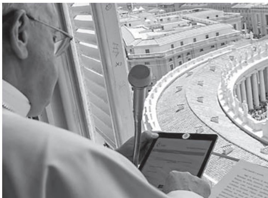
El Papa busca promover la reflexión sobre las causas y consecuencias de la desinformación en medios.

Sin embargo, para no privarnos de compartir contenidos, que es uno de los entretenimientos de las redes, lo que debemos hacer es reconocer si