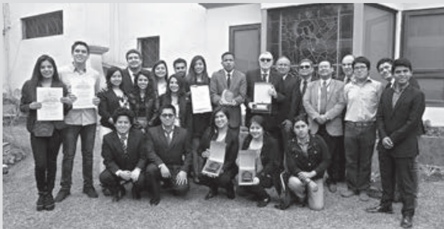
Alumnos y docentes de la USMP con los premios por su aporte al periodismo nacional.