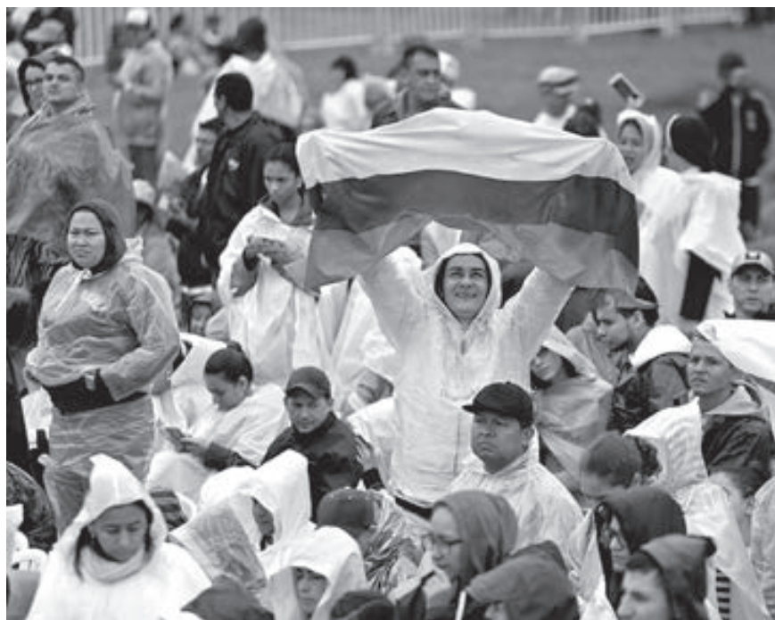
Más de tres millones de personas presenciaron al Papa Francisco en Colombia.

esa ciudad, instó a los colombianos a responder con la cultura del encuentro, animó a los asistentes a una de las cuatro misas oficiadas durante los cinco días que visitó el país.