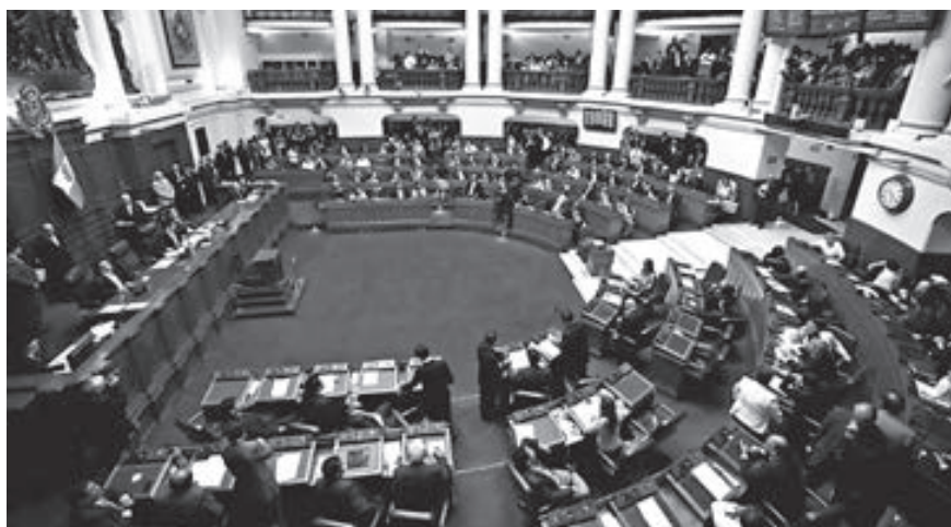
Pleno del Congreso decidió no otorgar la confianza al Gabinete de Fernando Zavala Lombardi.