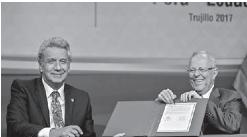
Pedro Pablo Kuczynski y Lenín Moreno, participaron del Encuentro Presidencial.

Cada Gabinete Binacional se estructura en función a determinados