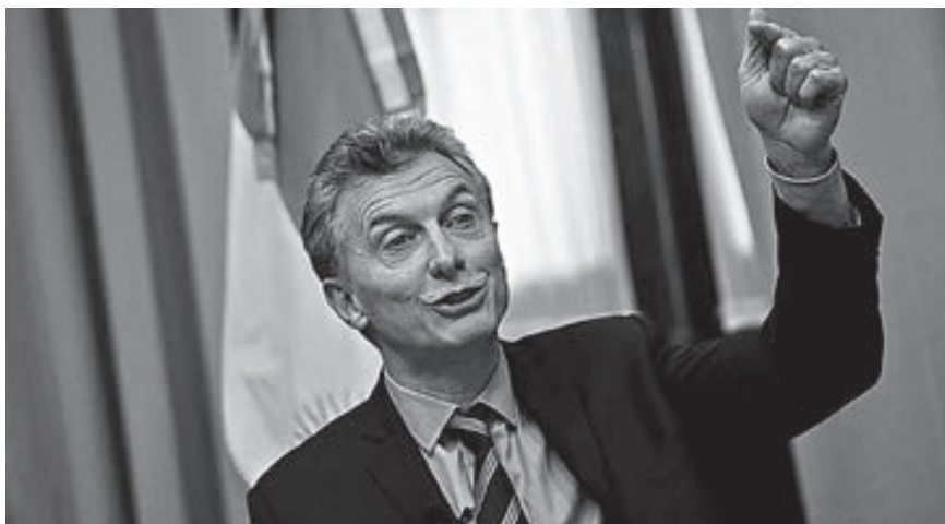
Mauricio Macri, lucha contra el Parlamento que no le ha permitido llevar a cabo las reformas.

Tras las elecciones legislativas parciales del domingo 22 de octubre, la agenda reformista debería cobrar un fuerte impulso aunque estará sujeta a negociaciones entre el partido gubernamental y otras fuerzas, espe-