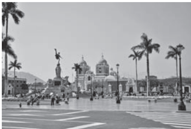
Plaza de Armas de Trujillo.

La virgen de la Puerta, que llegó a la catedral de esa ciudad, en peregrinación el pasado 15 de enero, estará presente en la misa que