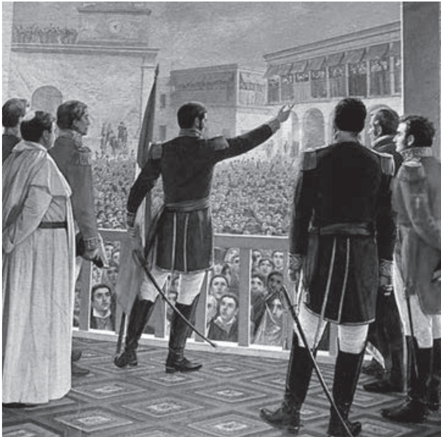
El Perú se prepara a celebrar el Bicentenario de la Independencia.

de los derechos civiles y políticos, consagrados en instrumentos internacionales de derechos humanos y de lucha contra la corrupción 9 .