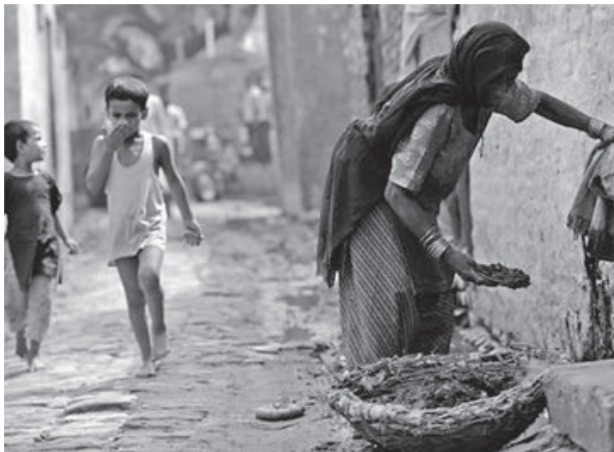
La solidaridad implica que los hombres cultiven la conciencia con la sociedad en la que están.

El Cardenal Hoffner (2001, p. 44), nos recuerda que “el ser humano, es por esencia persona, y a la vez, está referido por esencia a la sociedad, el principio estructural de la sociedad se basa en una original y peculiar