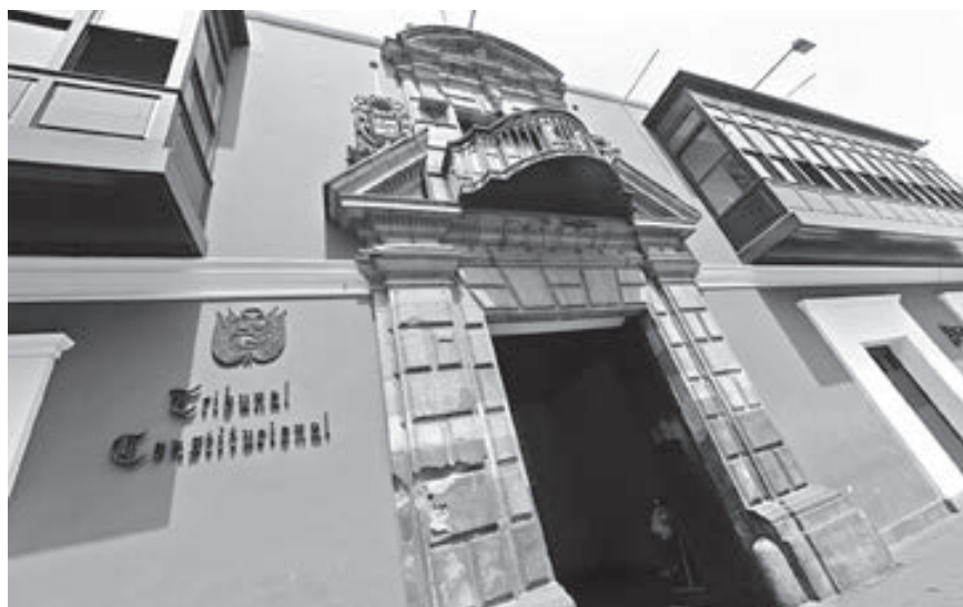
El Tribunal Constitucional del Perú.

De otro lado, es cierto que en nuestro país no es totalmente extraño que entre nuestras más altas instituciones se presenten tensiones y ciertas fricciones; pero, lo usual es