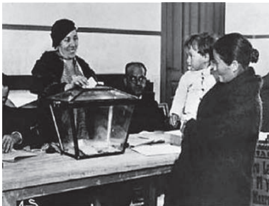
Desde 1956 todas las mujeres peruanas pueden participar en procesos electorales.

A la fecha ya existen propuestas de reforma interesantes planteadas